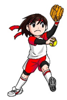
圧倒的な攻撃力で連覇した2-2区の選手のみなさん

ソフトボール大会成績 優勝 : 2-2区 準優勝 : 2-3区 第三位 : 中沢地区